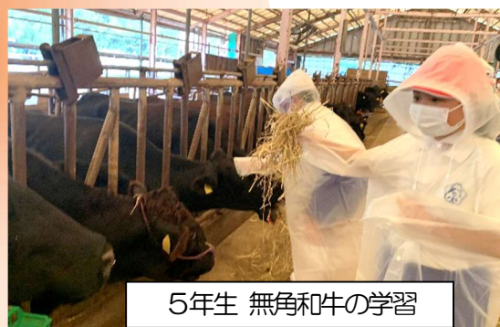
5年生 無角和牛の学習