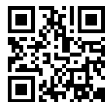
阿武小ホームページ

そこで、今後は、ホームページ等に掲載する児童の様子を充実させてまいりたいと考えています。また、コロナ禍ではありますが、保護者や地域の方の力をお借りしながら、児童の「学び」と「育ち」につながる取組を、持続可能な視点をもちながら工夫して行い、直接、その様子に触れていただけるよう努めてまいります。