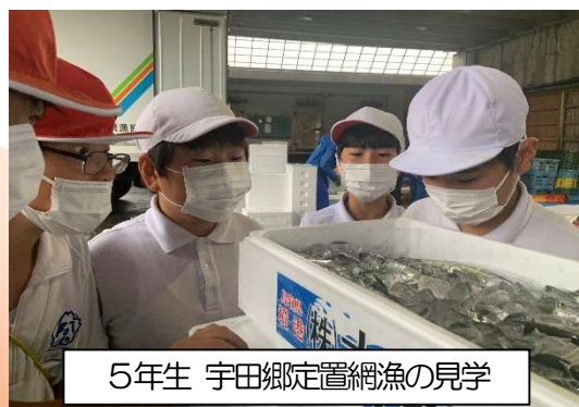
5年生 宇田郷定置網漁の見学