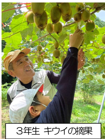
3年生 キウイの摘果