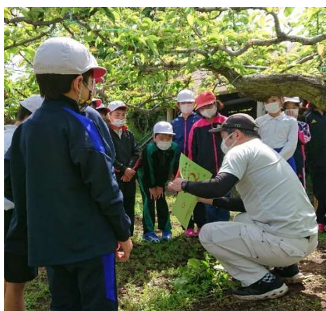
4年生 福賀梨の学習とパンフレット配布